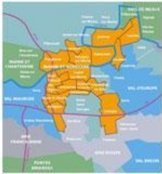
Plan de la Communauté d'agglomération

La naissance de la communauté de communes de Marne et Gondoire a eu lieu en 2001.