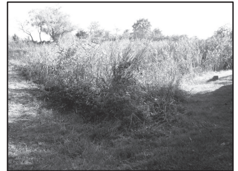
La mare en 2014

Les opérations de faucardage des roseaux réalisées depuis 2008 par les membres de l'association « Les Amis de Carnetin » auront permis de retarder le phénomène d'eutrophisation. Mais le processus est irrémédiable et seul un curage peut venir à bout de ce phénomène.