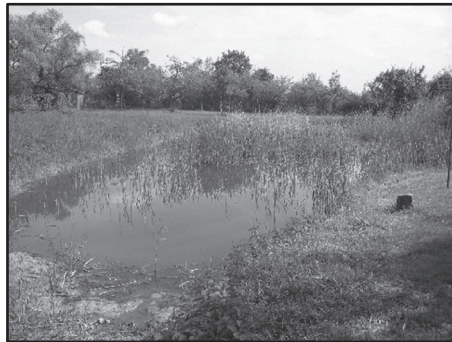
La mare en 2005