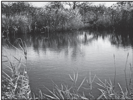
La mare en 1974

Depuis le milieu des années 2000, vous avez pu observer une dégradation de la mare du village. Les roseaux ont peu à peu colonisé la surface. C'est malheureusement ce qui arrive souvent sur des pièces d'eau trop peu profondes. Sans intervention humaine, la mare est vouée à disparaître.